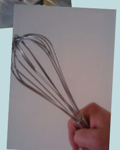
Mand, kok, 35 år, diagnosticeret 1999, København